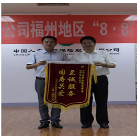
2015年8月，快速理赔超强台风“苏迪罗”受灾客户

我公司以客户为中心，以专业理赔为基础，坚持“主动、及时、准确、合理”的理赔宗旨，关注客户体验，丰富服务内容，努力做到“便捷理赔、快速理赔、透明理赔”。为广大客户抢险救灾，恢复生产提供了巨大的支持，为经济发展与社会稳定做出了积极贡献。立足集团一体化综合经营，发生巨额赔款时，我公司可在最短的时间内调集资金及时赔付。