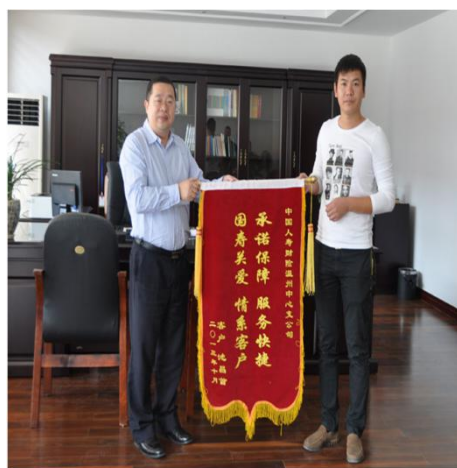
2013年10月，快速赔付台风“菲特”受损客户