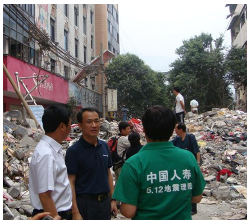
2008年四川汶川地震，中国人寿全系统给付3.78亿元，累计捐款6000万元；